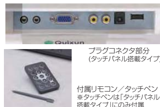
プラグコネクタ部分 (タッチパネル搭載タイプ)

PC入力は高解像度XGA(画素数1024×768)対応のD-sub15ピン端子接続、ビデオ入力はRCA端子接続対応です。またスピーカー内蔵式、専用リモコン付属ですので、より柔軟で自由な運用が求められるショップやエントランス、イベント会場などでの設置に最適です。