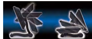
デュアルヒンジスタンドのモーションイメージ